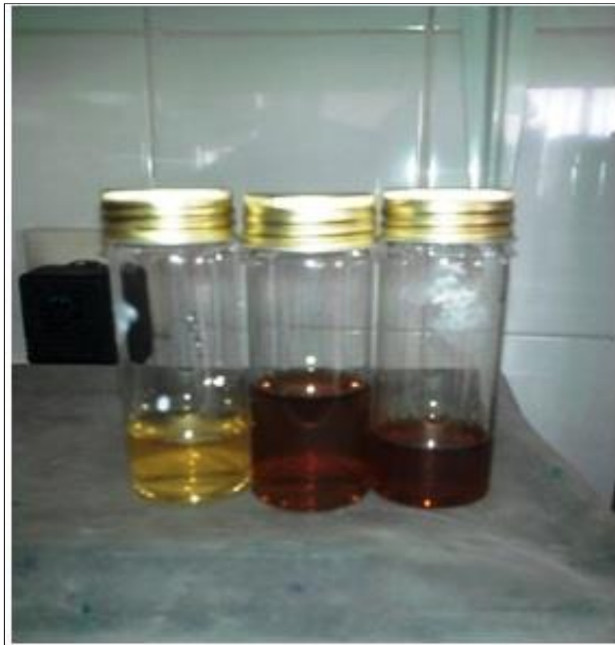
شکل ۱: تغییر رنگ محلول با گذشت ۹۰ دقیقه زمان از قهوه ای متمایل به زرد کم رنگ به قهوه ای تیره پس از اضافه نمودن محلول نیترات نقره (Bita et al. , 2015).

در این مطالعه از نانو ذرات نقره سنتز شده از عصاره جلبک دریایی Sargassum angustifolium با غلظت ۱۰۵/۷ میلی گرم در لیتر و اندازه ذرات ۳۲/۵۴ نانومتر (Bita et al. , 2015) برای بررسی تأثیر آن بر شاخص های خونی ماهی کپور معمولی ( Cyprinus carpio ) استفاده شد (شکل ۲).